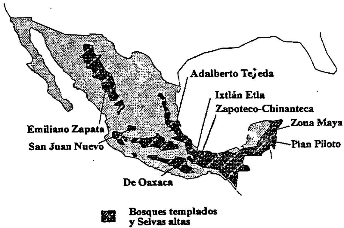
Fig. 1.- Localización de algunas Organizaciones campesinas forestales en México.